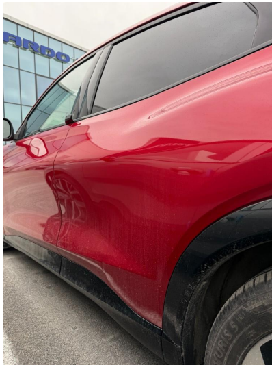
1.1 Bulk bakdør venstre.