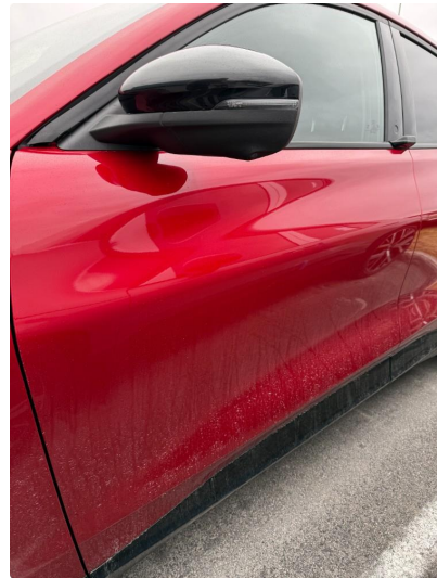
1.2 Minibulk 2stk dør venstre foran.