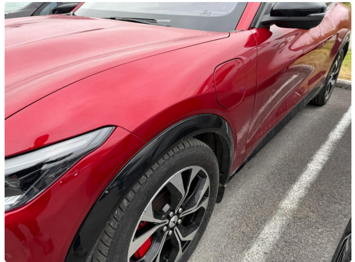
1.4 Minibulk skjerm venstre foran.