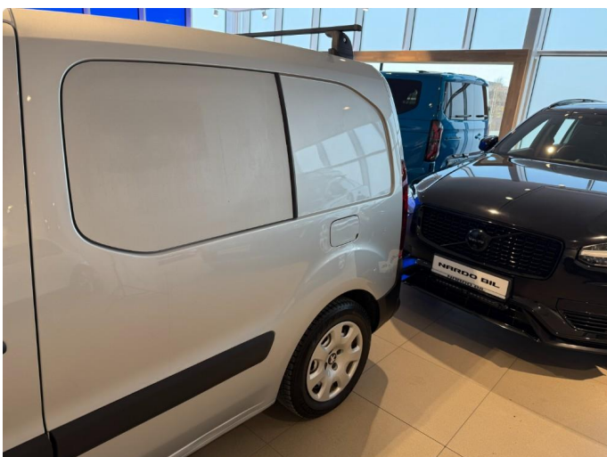
1.3 Flere små bulker skjerm/panel venstre bak.