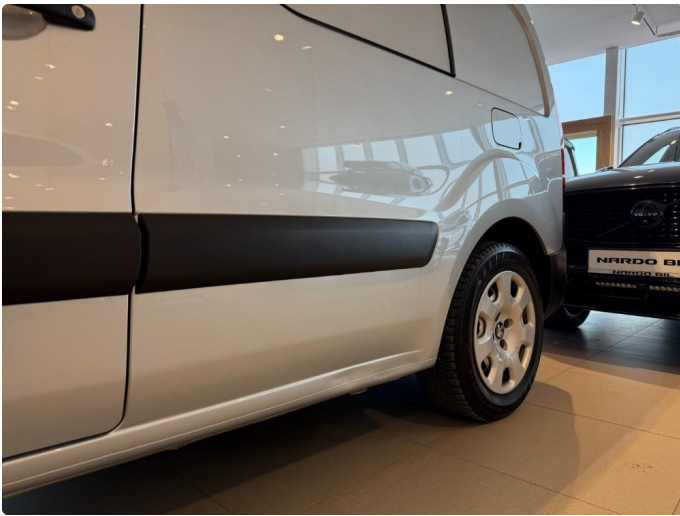
1.10 Bulk kanal venstre.