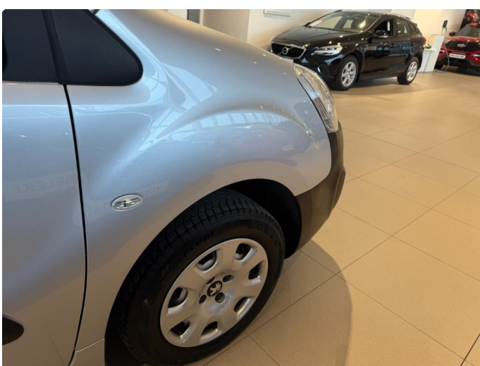
1.5 Liten bulk skjerm høyre foran.