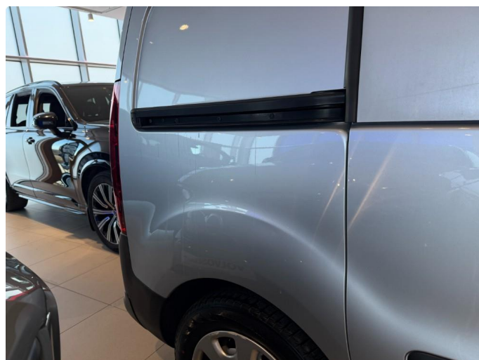
1.4 Liten bulk skjerm høyre bak.