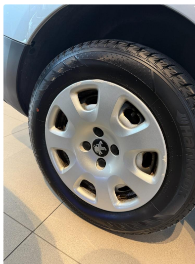
1.6 Riper i en hjulkapsel.