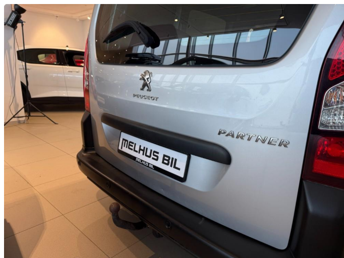
1.2 Bulk bakluke.