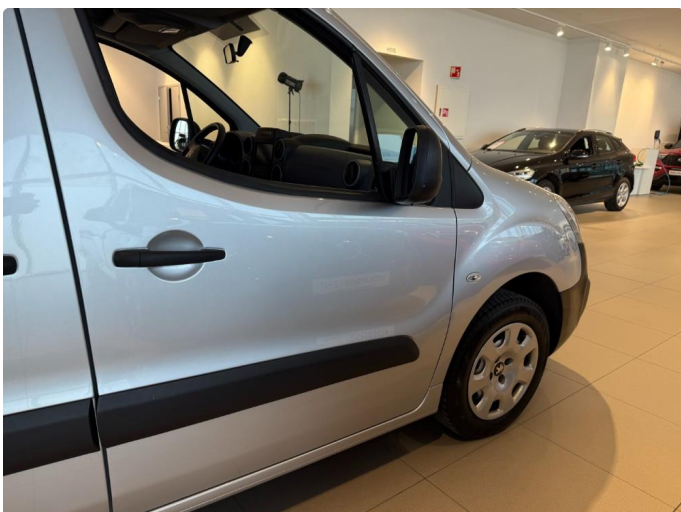
1.1 Minibulk dør høyre foran.