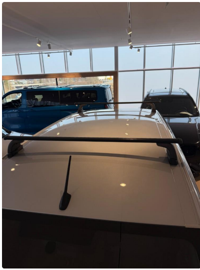
1.9 Tre bulker tak.