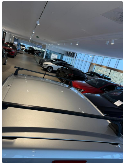
1.9 Tre bulker tak.