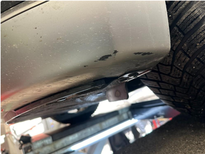
1.1 Riper underkant støtfanger foran.