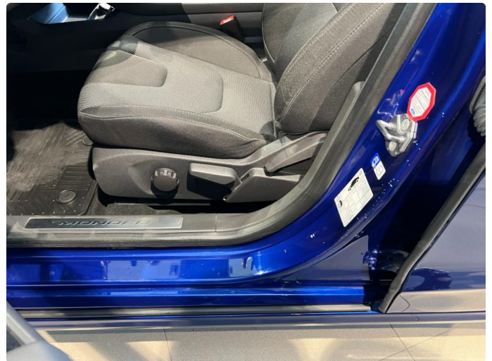
1.4 Flere riper døråpning venstre foran