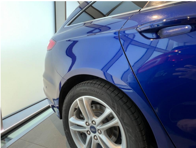
1.3 To minibulker bakskjerm høyre.