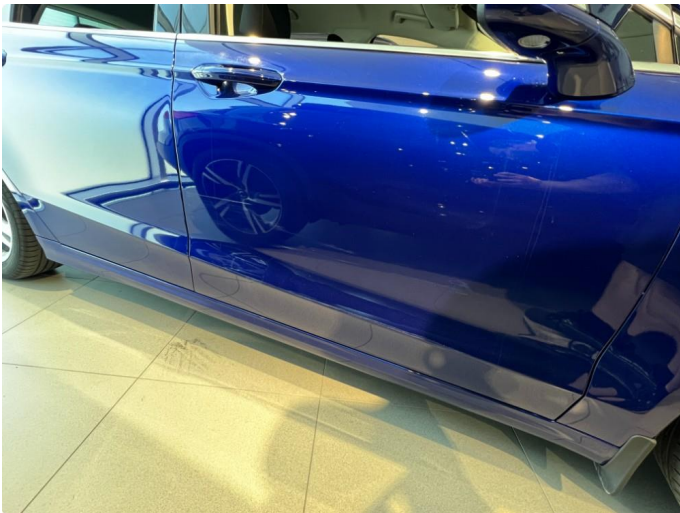
1.1 Liten bulk dør høyre foran