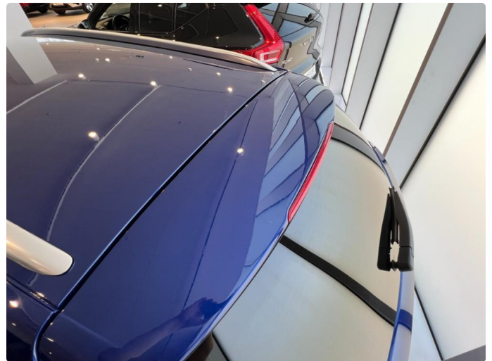
1.2 Små riper spoiler