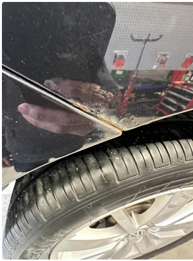
1.6 Korrosjon hjulbue høyre bak.