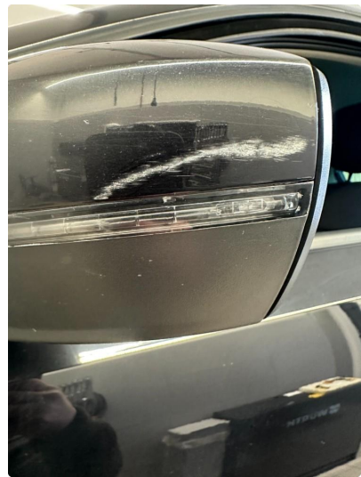
1.7 Riper speilhus begge sider.