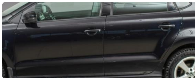
1.2 Noen riper begge dører venstre.