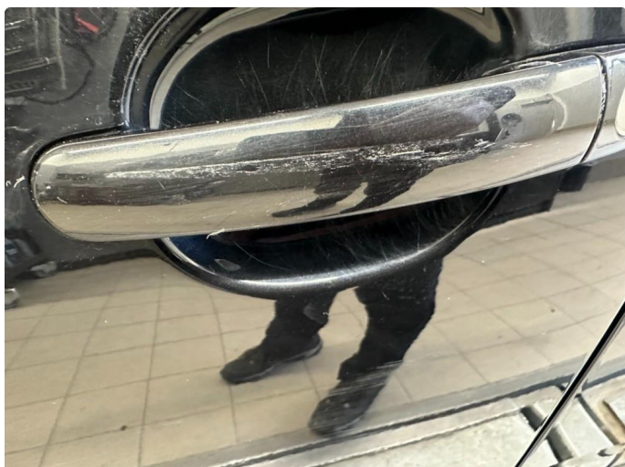
1.1 Ripe dørhåndtak venstre foran.