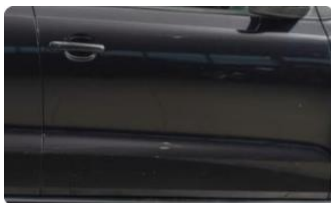
1.4 Bulk framkant dør høyre foran.