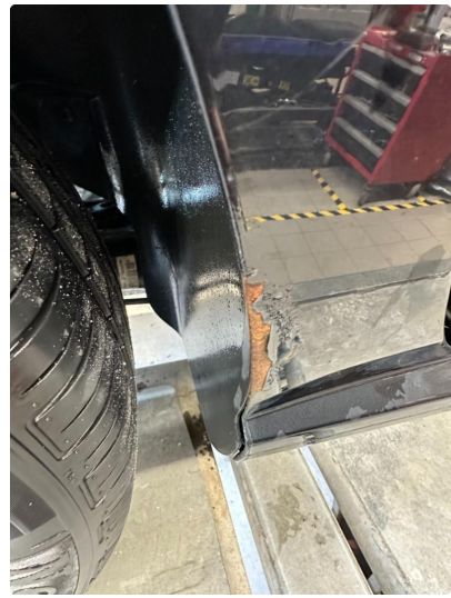
1.6 Korrosjon hjulbue høyre bak.