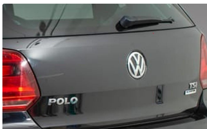
1.5 Riper og en bulk over bremselykt. Lakkbobbler over håndtak bakluke.