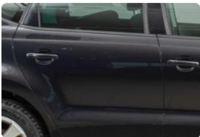
1.3 Frere minibulker og en ripe dør høyre bak.