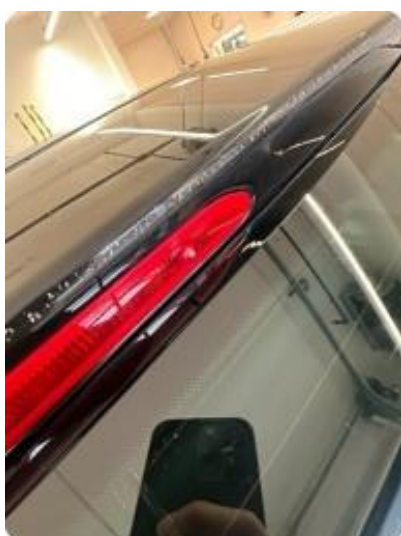
1.5 Riper og en bulk over bremselykt. Lakkbobbler over håndtak bakluke.