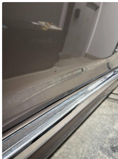
1.1 3 minibulker førerdør.