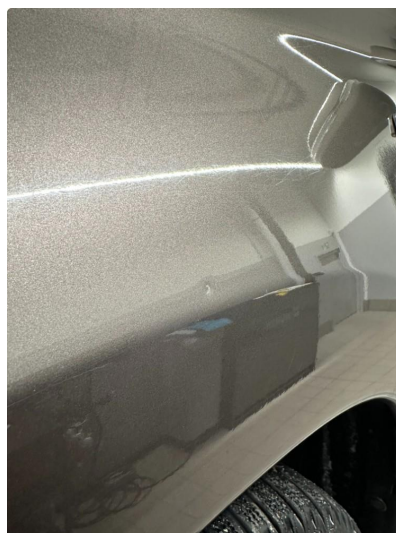
1.2 1 minibulk skjerm venstre foran.