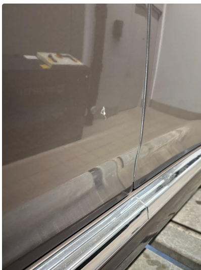
1.1 3 minibulker førerdør.