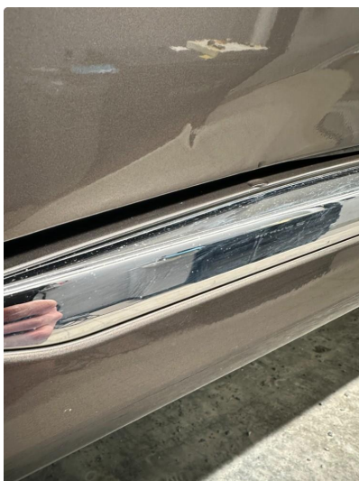
1.1 3 minibulker førerdør.