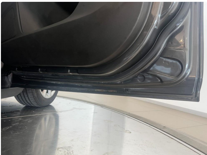
1.1 Korrosjon innside dør høyre foran.