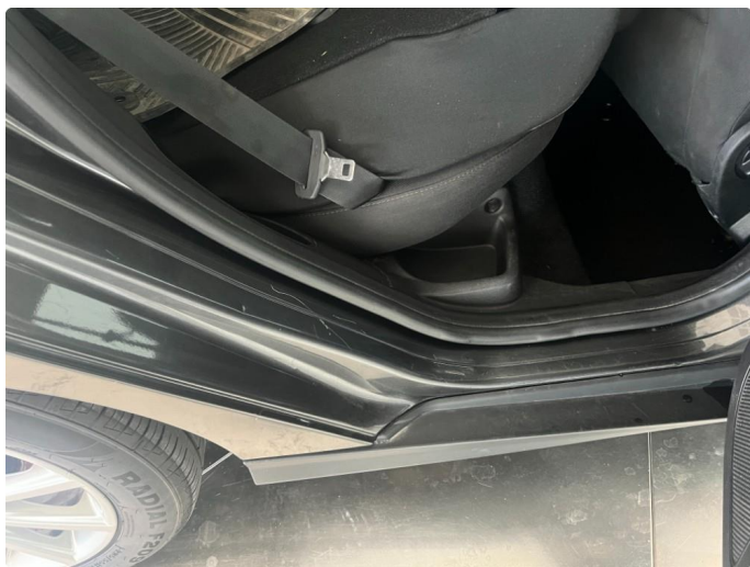
1.5 Små bulker og riper døråpning høyre bak.