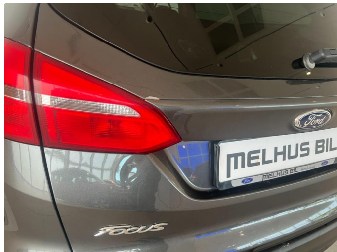
1.2 1 bulk og korrosjon bakluke.