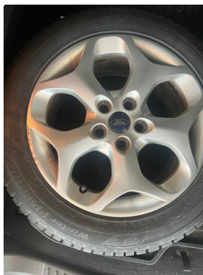
1.4 Riper i 1 sommerfelg og 1 vinterfelg.