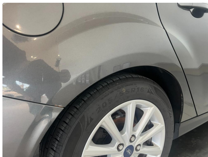
1.3 Korrosjon mot støtfanger skjerner begge bak.