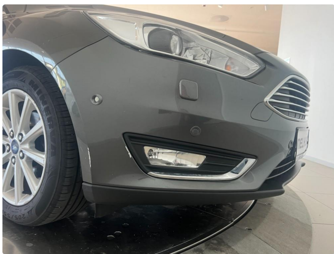
1.7 2 riper støtfangerhjørne høyre foran.