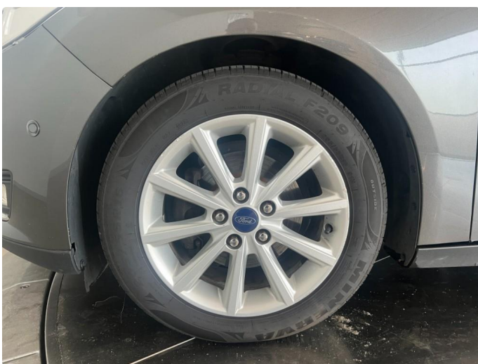
1.4 Riper i 1 sommerfelg og 1 vinterfelg.