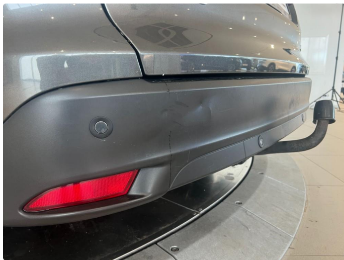
1.6 Liten bulk støtfanger bak.