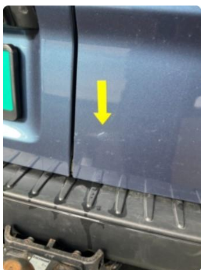
1.4 En minibulk og liten ripe baktør høyre.