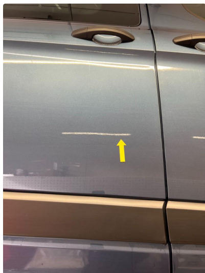
1.1 Minibulk skyvedør høyre.