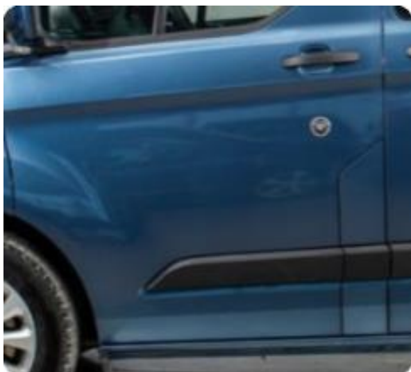
1.3 2 minibulker førerdør.