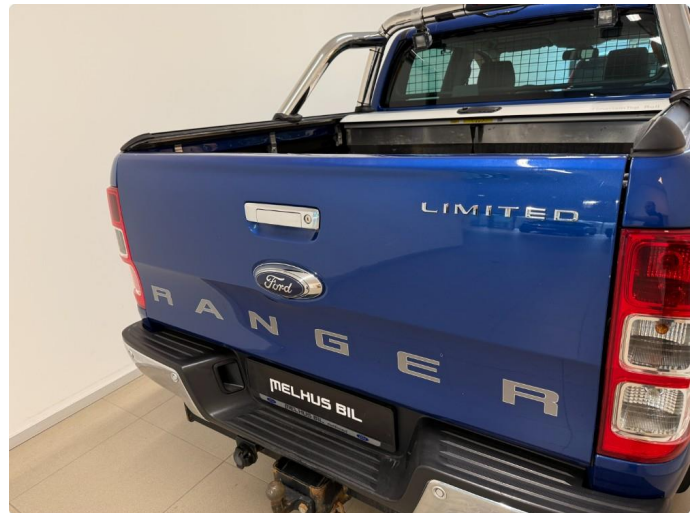
1.2 Små bulker bakluke.