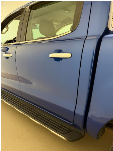
1.1 Minibulk bakdør og C-stolpe venstre.