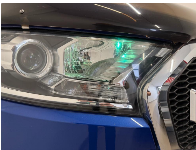
2.1 Feil farge parklys foran.