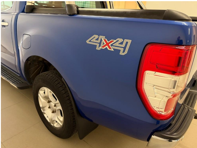
1.3 Minibulk bakskjerm venstre.