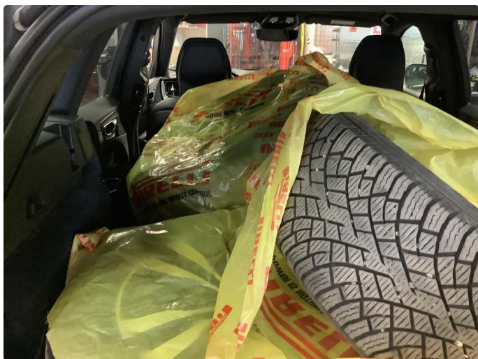
2.2 Øvrige feil