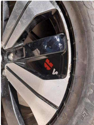
1.2 Kantkjørt felg Diamond Cut