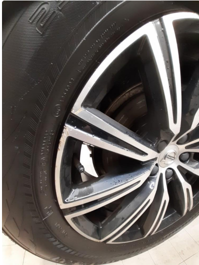
2.1 Kantkjørt felg Diamond Cut