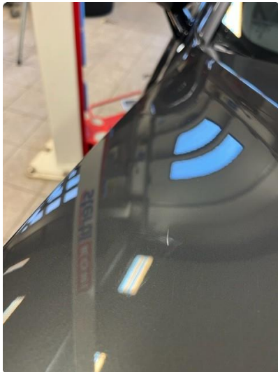
1.1 Ripe(r) ned til grunning