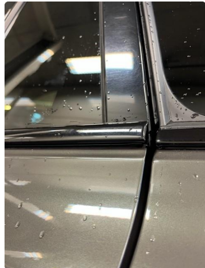
1.2 Løse/skadede lister