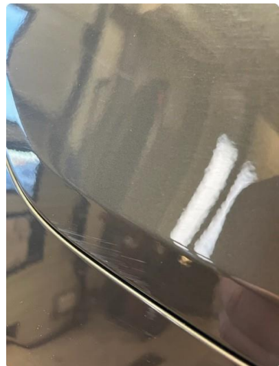
1.3 Ripe(r) ned til grunning