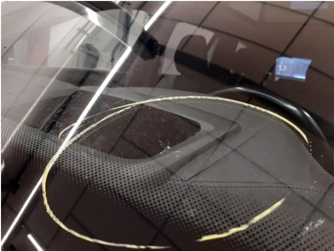
1.1 Steinsprut i synsfelt