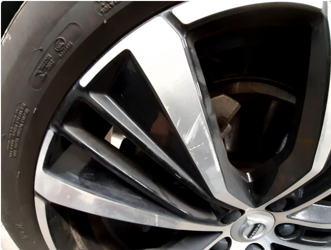
1.1 Kantkjørt felg Diamond Cut