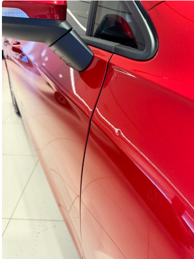
1.1 Parkeringsbult høyre framskjerm (ikke gjennom lakk)