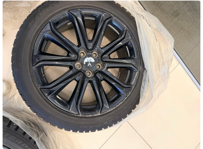
1.4 Kantkjøring i vinterfelg 2