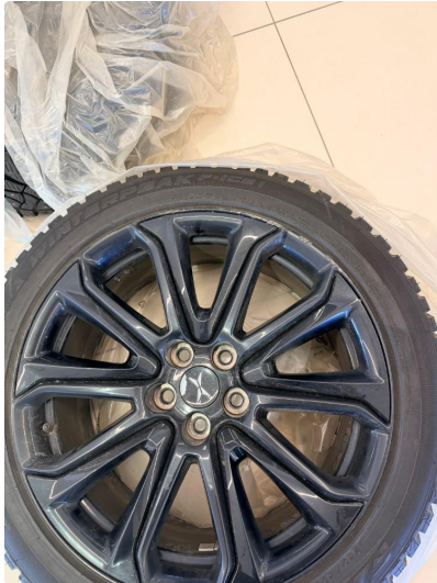
1.3 Kantkjøring i vinterfelg 1