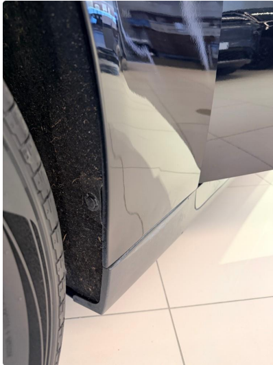
1.1 P bulk i framskjerm