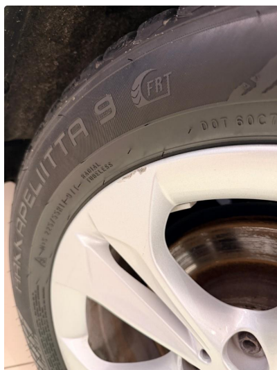
1.3 Merke i 1 felg Vinterhjul