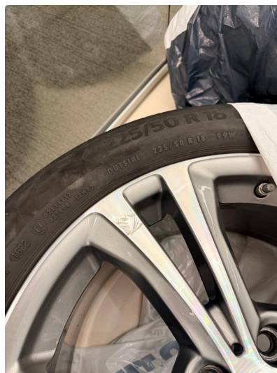
1.2 Merke i 1 felg sommerhjul