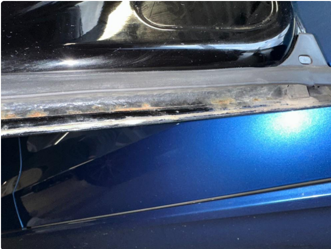
1.4 Rustblører begge framdører, og rust i fals begge fremdører. Kan ikke utelukker mer rust.