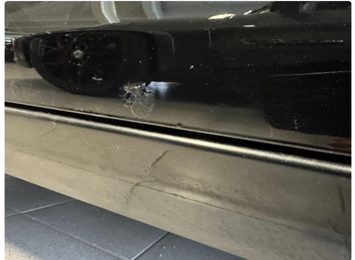
1.4 Rustblører begge framdører, og rust i fals begge fremdører. Kan ikke utelukker mer rust.