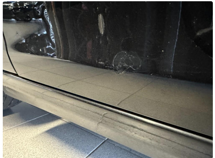
1.4 Rustblører begge framdører, og rust i fals begge fremdører. Kan ikke utelukker mer rust.