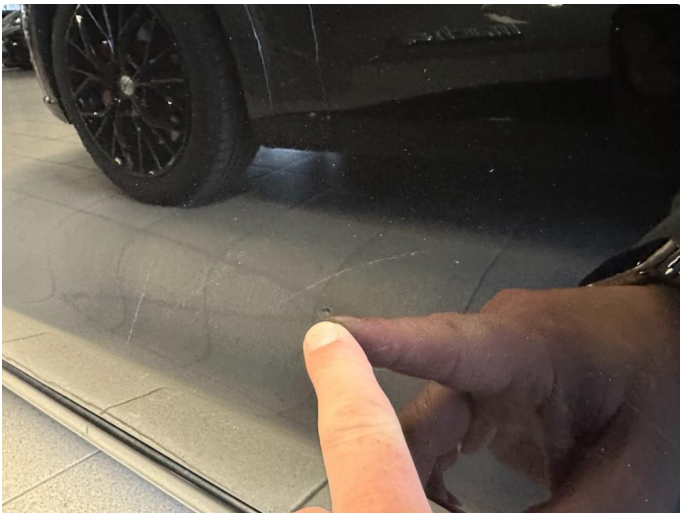
1.4 Rustblører begge framdører, og rust i fals begge fremdører. Kan ikke utelukker mer rust.