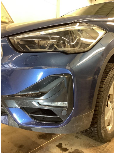
1.1 Liten sprekk i fanger foran