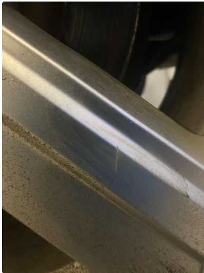
1.2 Skade på felg