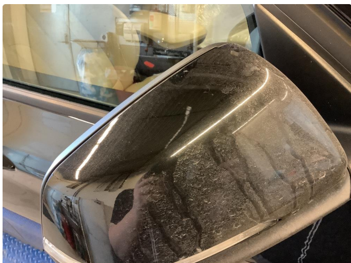
1.1 Speilhus riper