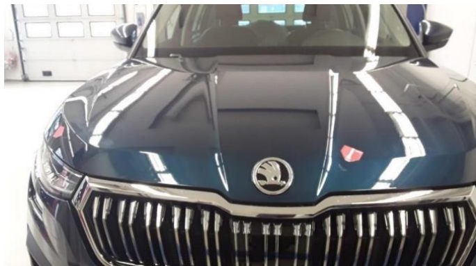
1.1 Ufagmessig utført arbeid