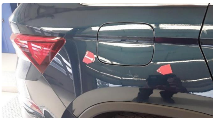
1.1 Ufagmessig utført arbeid