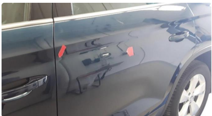
1.1 Ufagmessig utført arbeid