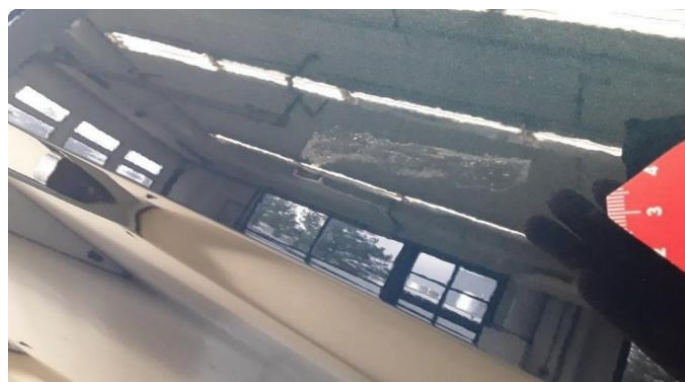
1.1 Ufagmessig utført arbeid