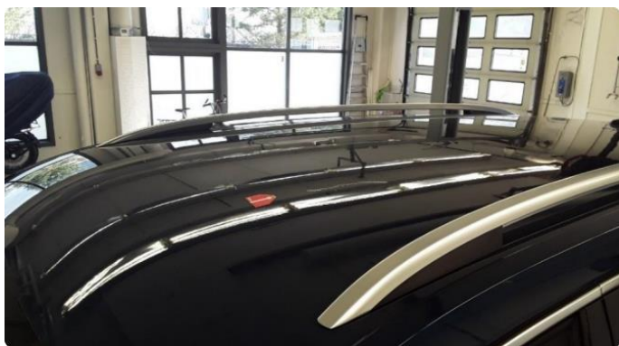
1.1 Ufagmessig utført arbeid