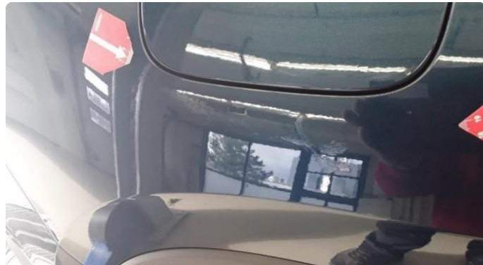
1.1 Ufagmessig utført arbeid