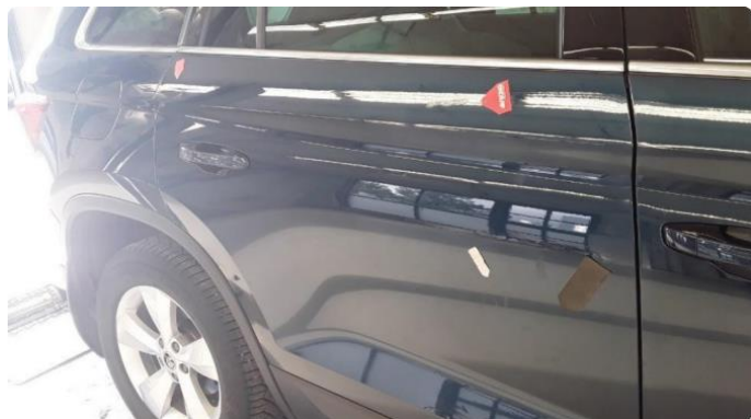
1.1 Ufagmessig utført arbeid