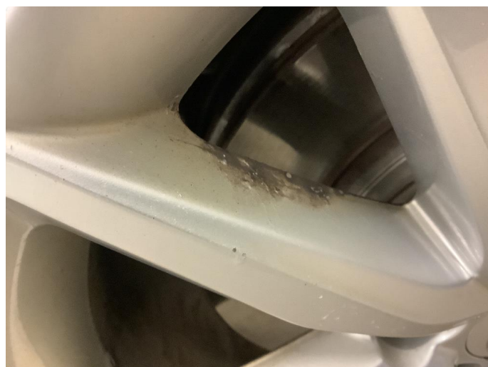
1.3 Påbegynnende oksidering