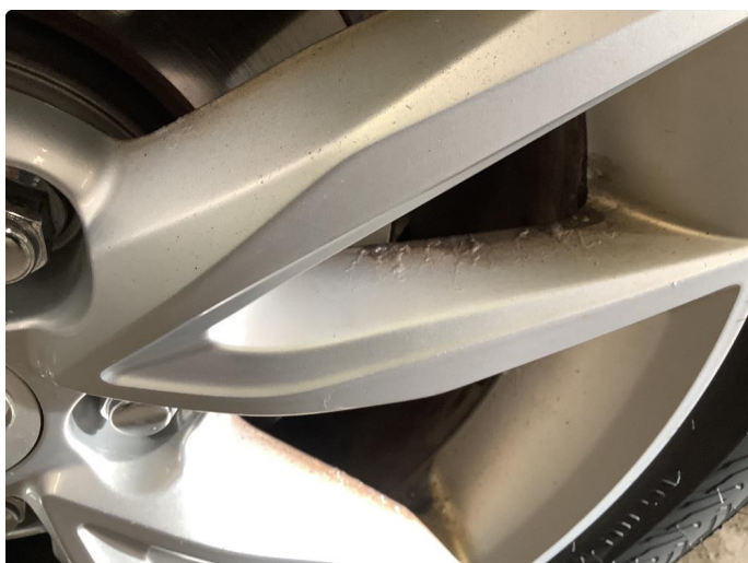
1.3 Påbegynnende oksidering