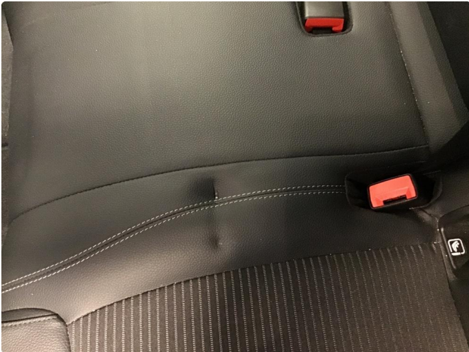
1.1 Skade på setepute