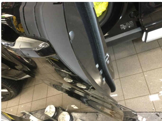
1.1 Ripe ned til grunning