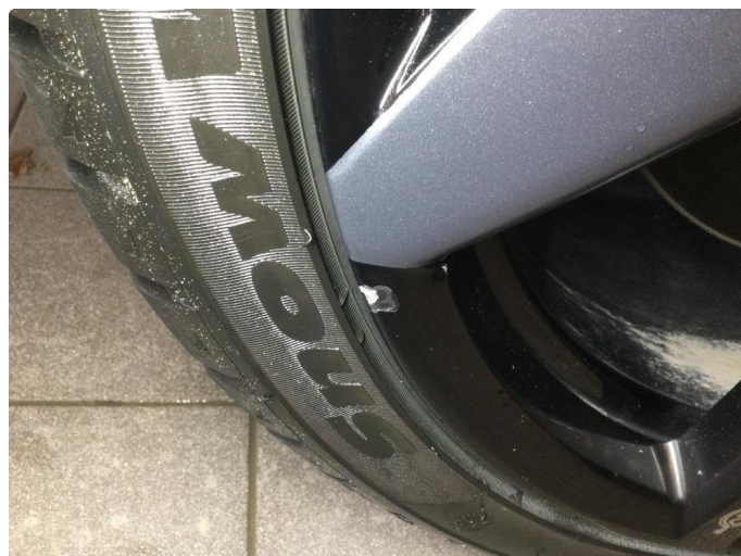
1.2 Skade på felg