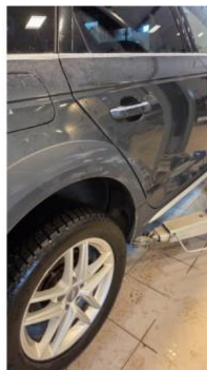
1.3 Flere riper på hjulbue bak, høyre side