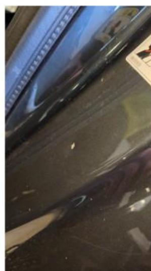
1.4 To små bulker på innsteg, venstre side bak