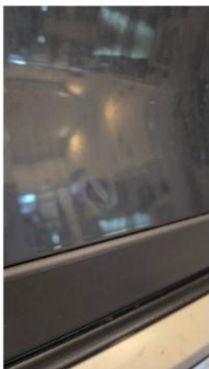
1.2 To bulker på høyre bakdør