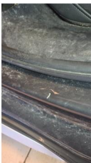
1.4 To små bulker på innsteg, venstre side bak