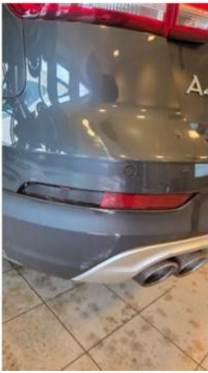
1.5 Riper og defekt refleks på støtfanger bak, venstre hjørne