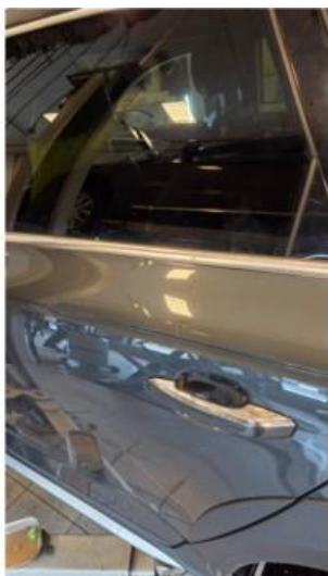
1.1 Ripe på venstre bakdør