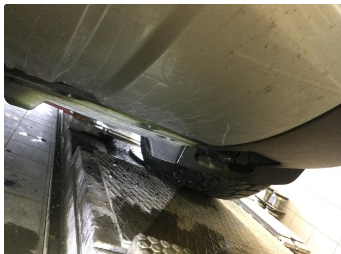
1.1 Øvrige feil