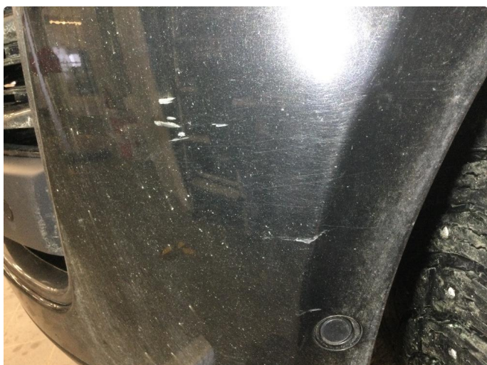
1.2 Ripe(r) ned til grunning