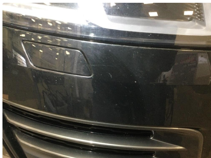
1.2 Ripe(r) ned til grunning