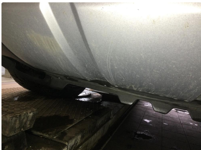
1.1 Øvrige feil