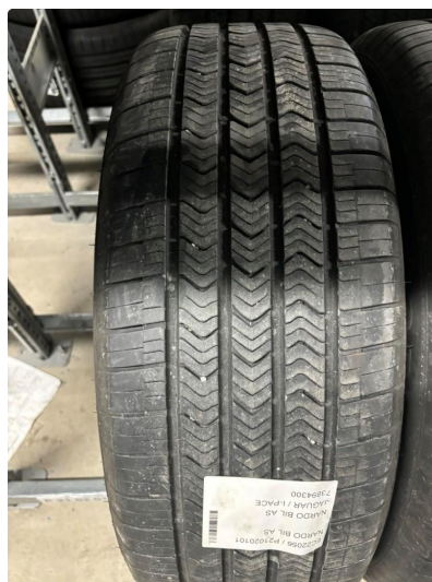
1.2 Øvrige feil