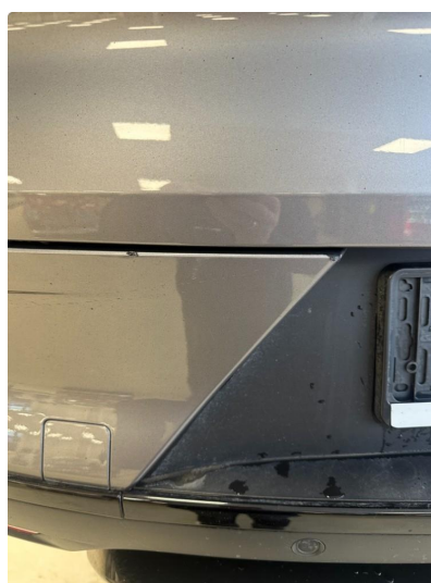
1.3 Ripe(r) ned til grunning