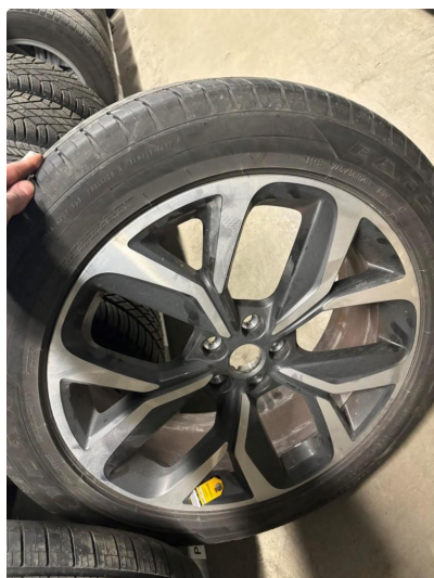
1.2 Øvrige feil