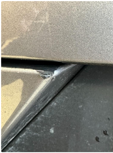
1.3 Ripe(r) ned til grunning