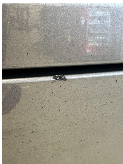
1.3 Ripe(r) ned til grunning