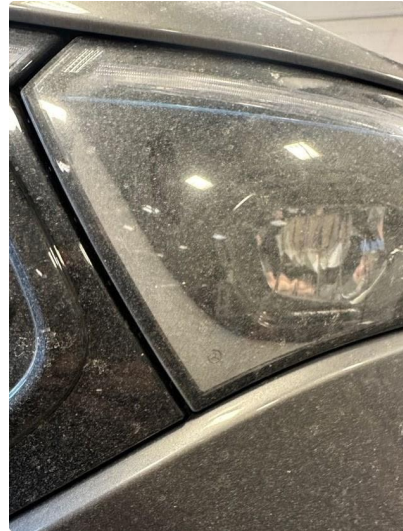
1.1 Litt dugg/fukt i hovedlykter foran