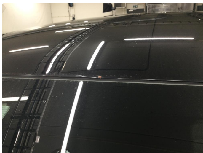
1.5 Steinsprut med rust