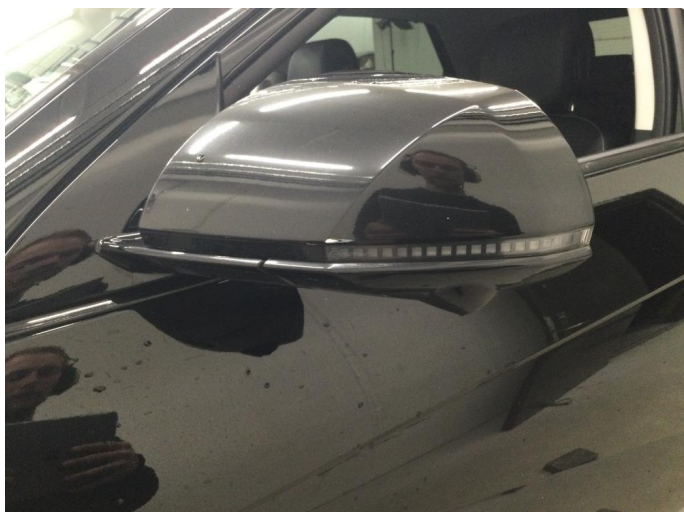
1.1 Speilhus riper