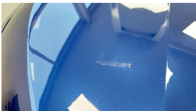
1.1 Ripe(r) ned til grunning