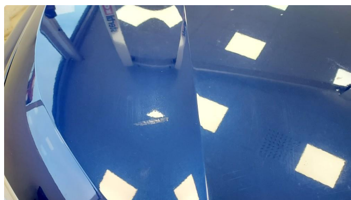
1.1 Ripe(r) ned til grunning