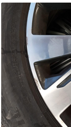
1.2 Skade på felg