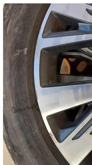
1.2 Skade på felg