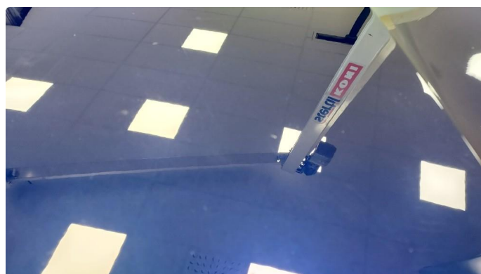
1.1 Ripe(r) ned til grunning