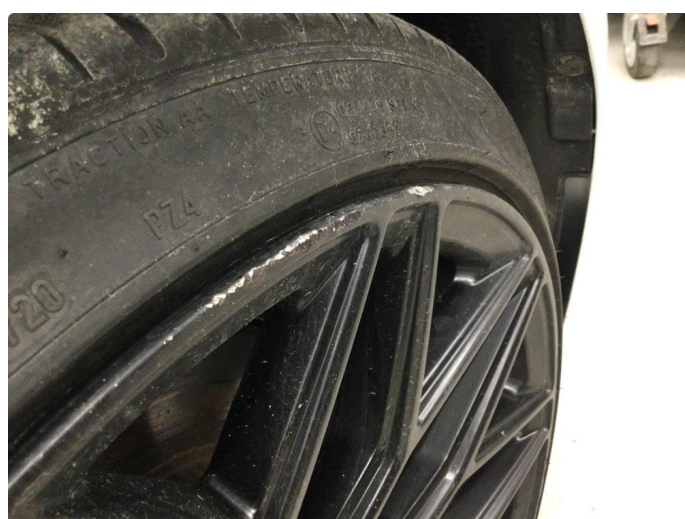
1.4 Kantkjørt felg