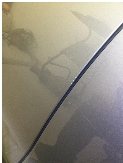
1.1 Noe steinsprut