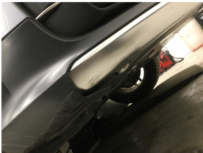
1.6 Skrubbskader underkant