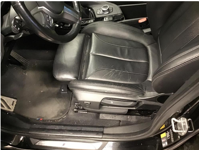
2.1 Skade på setepute