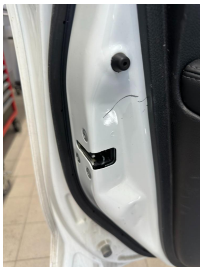
1.2 Riper i døråpning venstre foran.