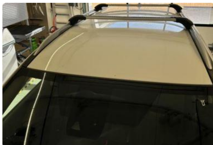
1.5 Flere steinsprang framkant tak.