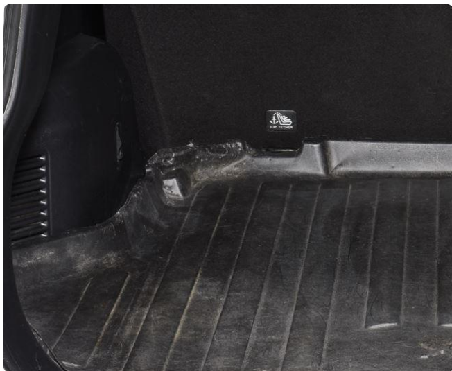
2.1 Bagasjeromsmatte skadet.