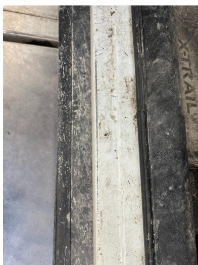
1.4 Slitt lakk ned til grunning.