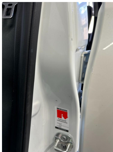
1.2 Riper i døråpning venstre foran.