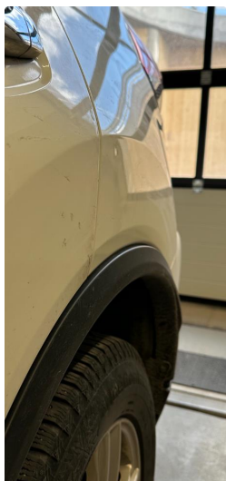
1.1 Minibulk skjerm venstre bak.