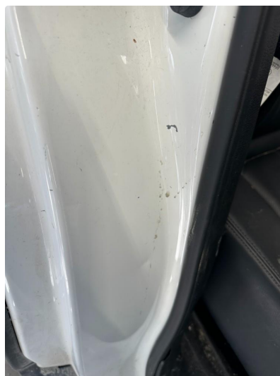
1.3 Liten bulk og rype døråpning høyre bak,