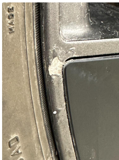
1.2 Påbegynnende oksidering