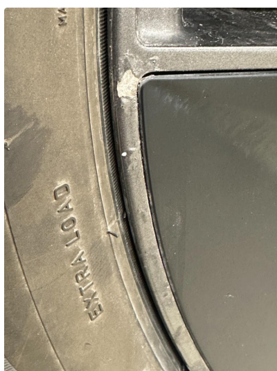
1.2 Påbegynnende oksidering