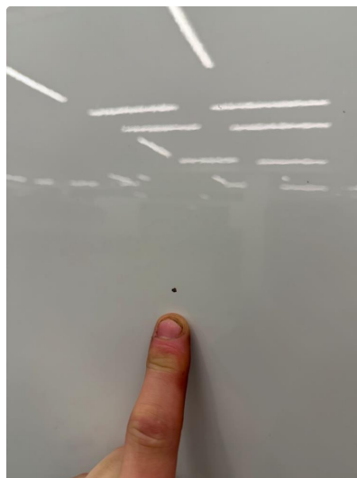
1.1 Noe steinsprut foran