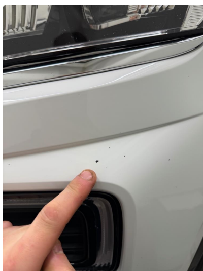
1.1 Noe steinsprut foran