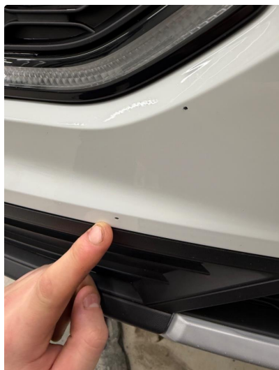
1.1 Noe steinsprut foran