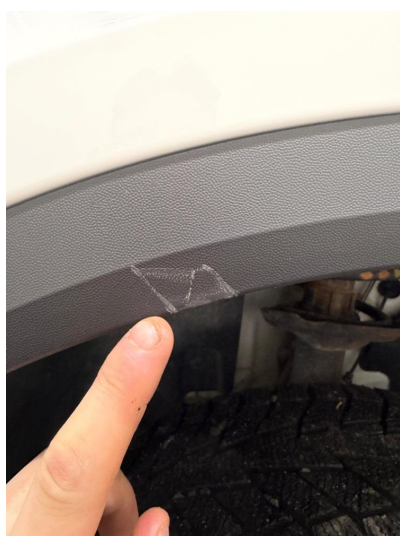
1.2 Bruksmerke i hjulbuelist.