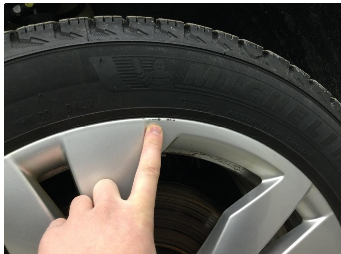
1.2 Ripe (r) gjennom lakk