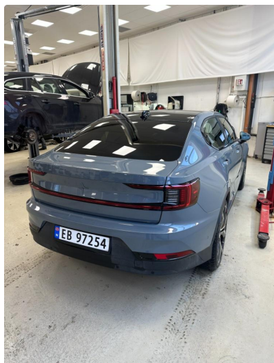
1.1 Forurensing lakk ytre påvirkning