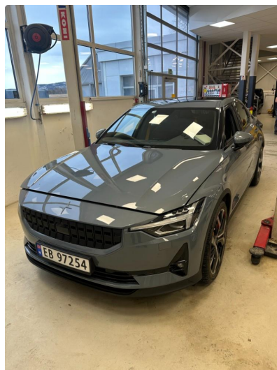
1.1 Forurensing lakk ytre påvirkning