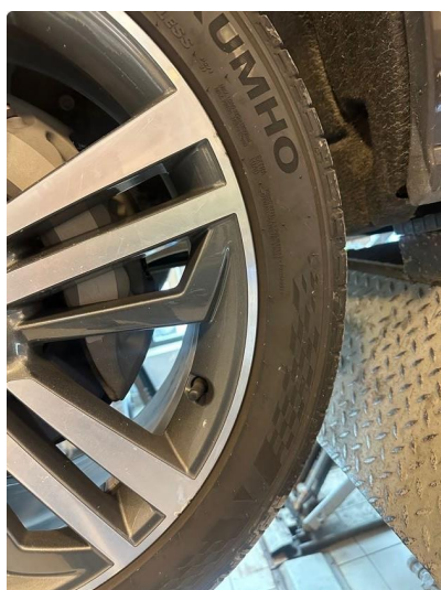
1.1 En sommerfelg litt kantkjørt