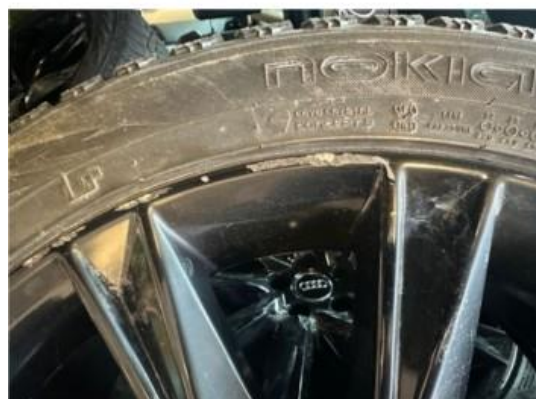
1.2 2 stk vinterfelger litt kantkjørt