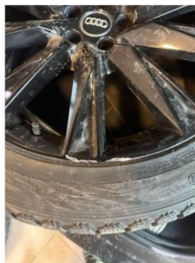
1.2 2 stk vinterfelger litt kantkjørt