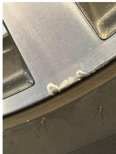
1.1 En sommerfelg litt kantkjørt