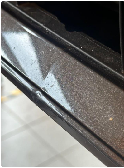
1.3 Liten bulk i fanger bak