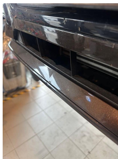
1.3 Liten bulk i fanger bak