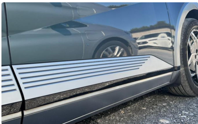
1.1 Lite hakk nedre pyntelist dør høyre foran.