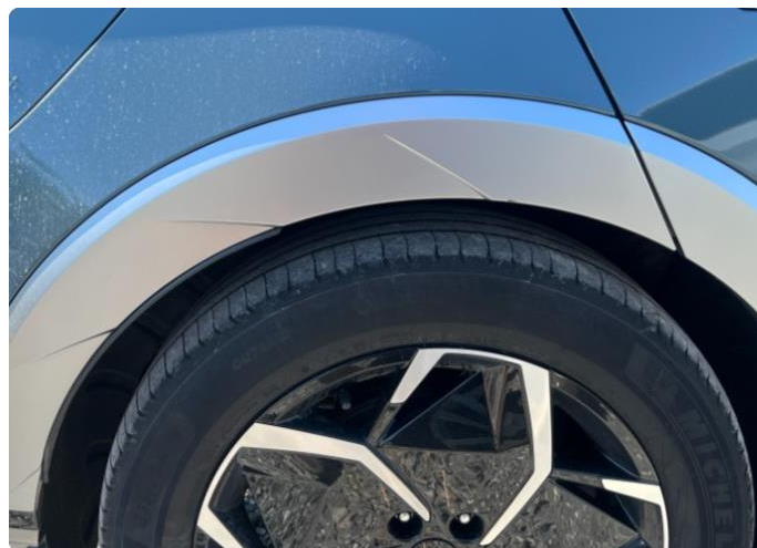
1.2 Lite hakk hjulbue høyre bak.