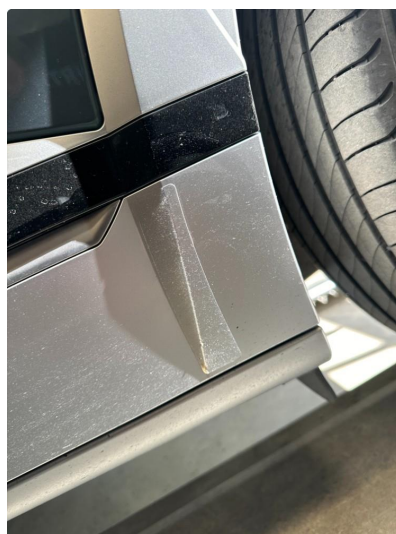
1.5 Matt/slitt lakk bakkant kanal begge sider.