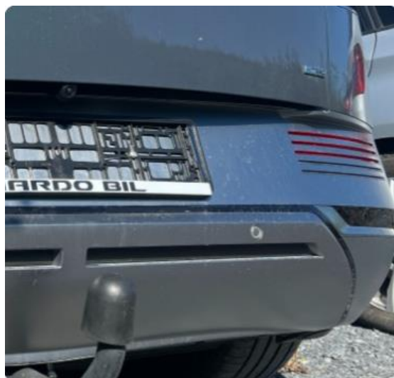
1.4 Liten bulk høyre side støtfanger bak.