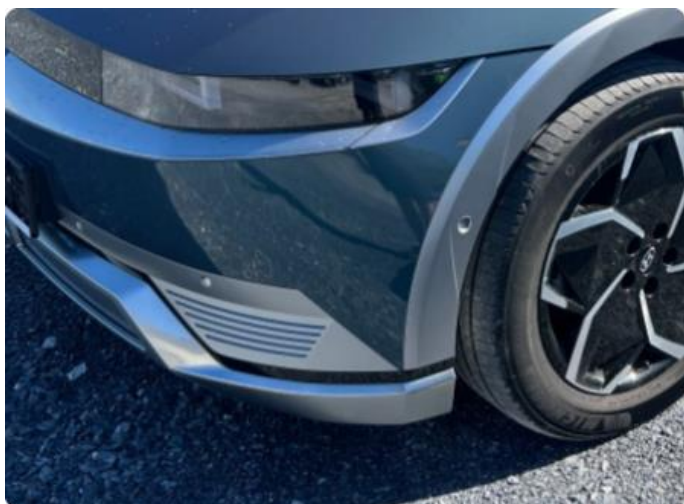
1.3 Liten ripe venstre side nedre del støtfanger foran