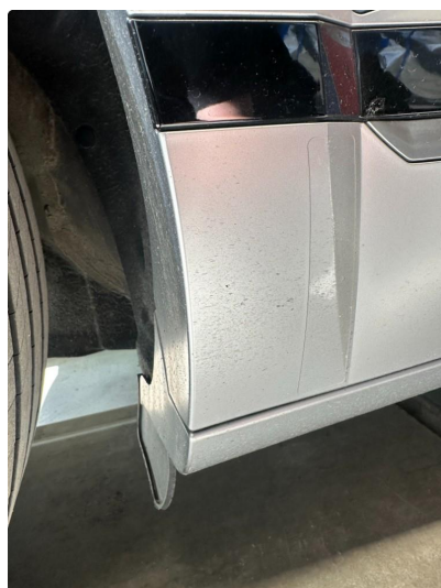
1.5 Matt/slitt lakk bakkant kanal begge sider.