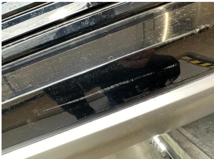
1.1 Små riper støtfanger bak.