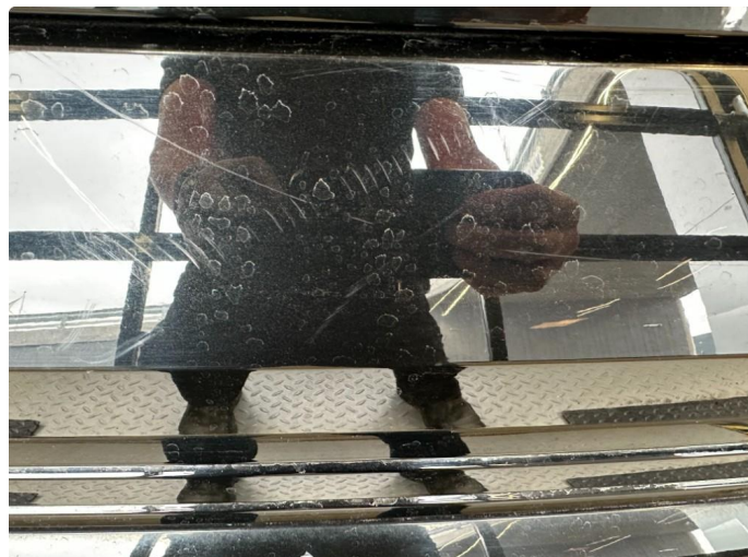
1.1 Små riper støtfanger bak.