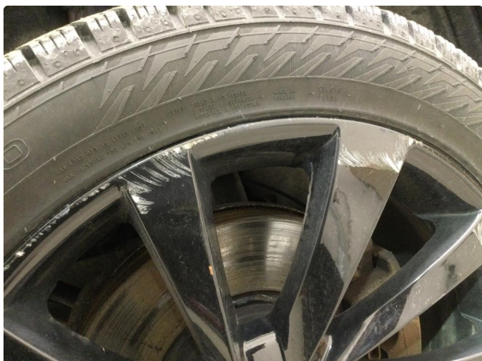
1.1 Ripe (r) gjennom lakk