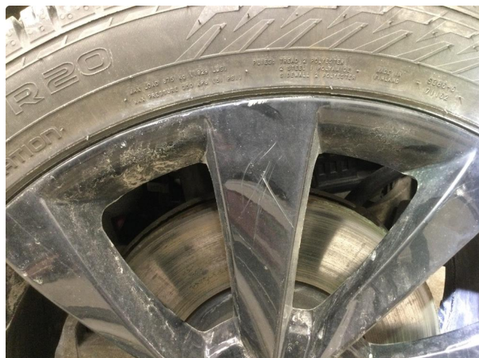
1.2 Ripe (r) gjennom lakk