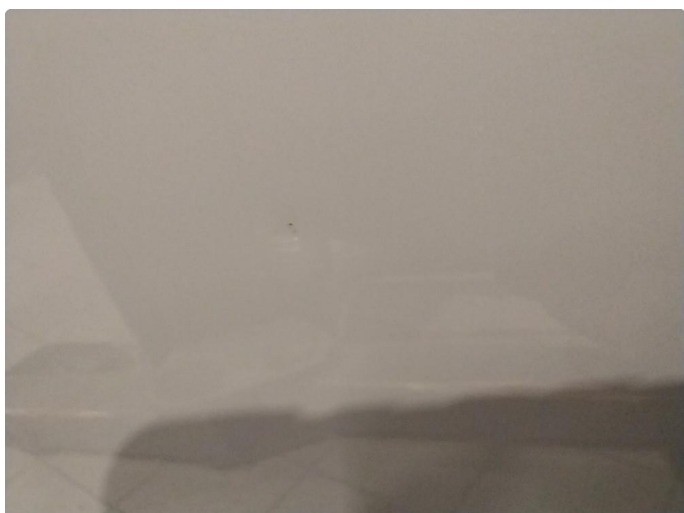
1.2 Små bulker på venstre fordører.