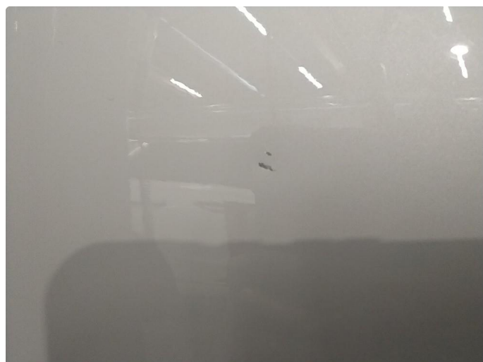
1.3 Små riper på høyre forskjerm.