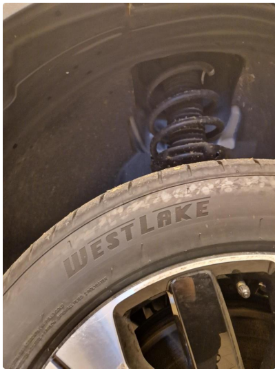
1.6 Øvrige feil