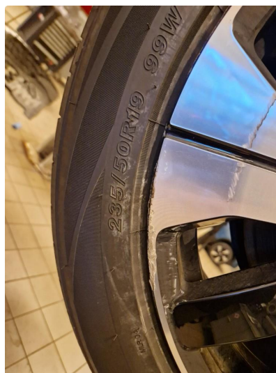
1.6 Øvrige feil