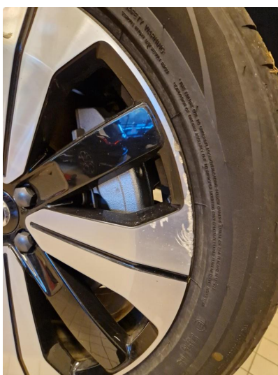
1.5 Kantkjørt felg