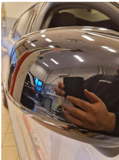
1.4 Deksel skadet/ripe