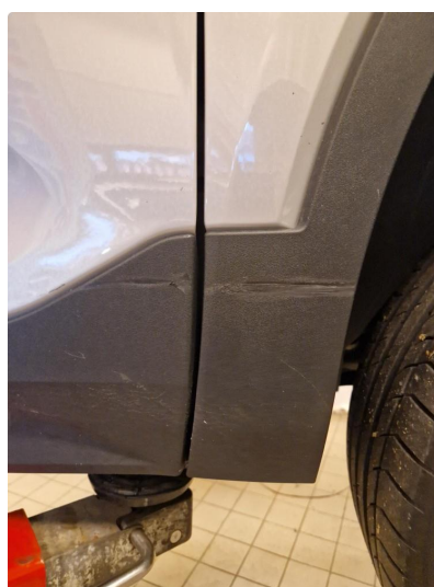
1.3 Skjermutbygger skadet