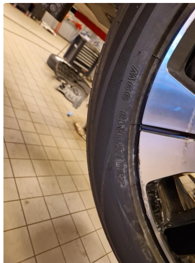
1.5 Kantkjørt felg