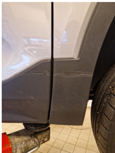
1.1 Løse/skadede lister