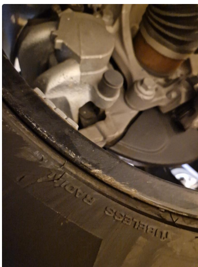
1.5 Kantkjørt felg