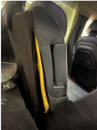
3.1 Skade på setetrekk