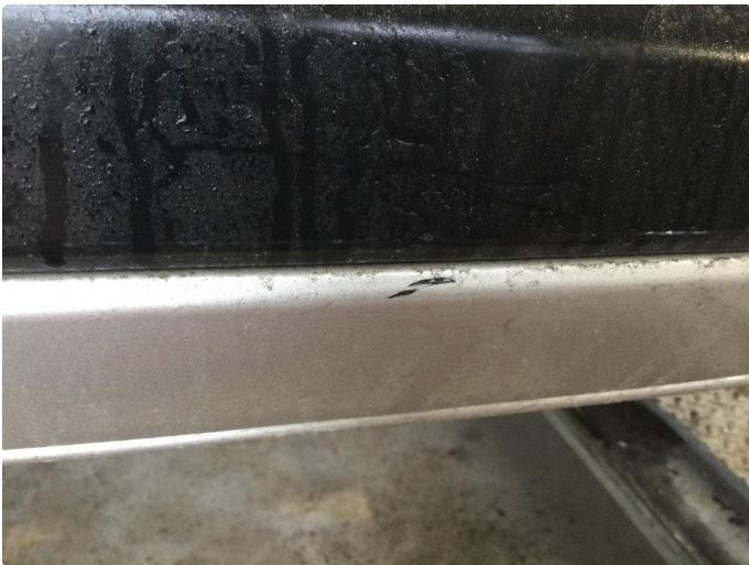
1.1 Noe bruksmerker. Normalt iht alder/kilometerstand.