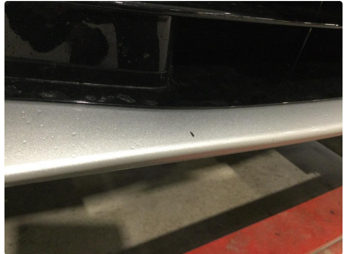
1.1 Noe bruksmerker. Normalt iht alder/kilometerstand.