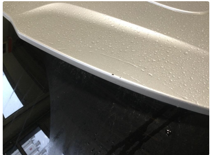
1.1 Noe bruksmerker. Normalt iht alder/kilometerstand.