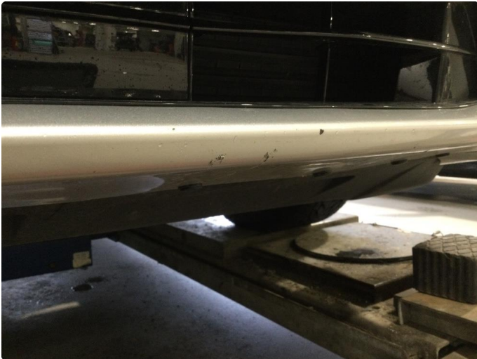
1.1 Noe bruksmerker. Normalt iht alder/kilometerstand.