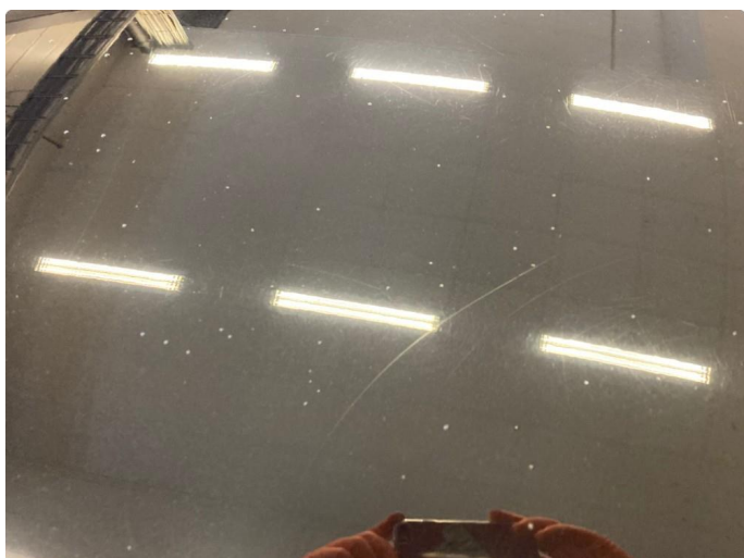
1.1 Generelt mye riper