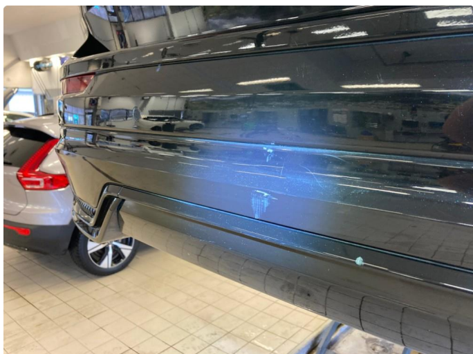
1.1 Generelt mye riper