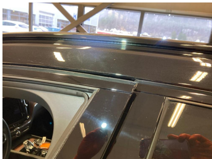
1.1 Generelt mye riper