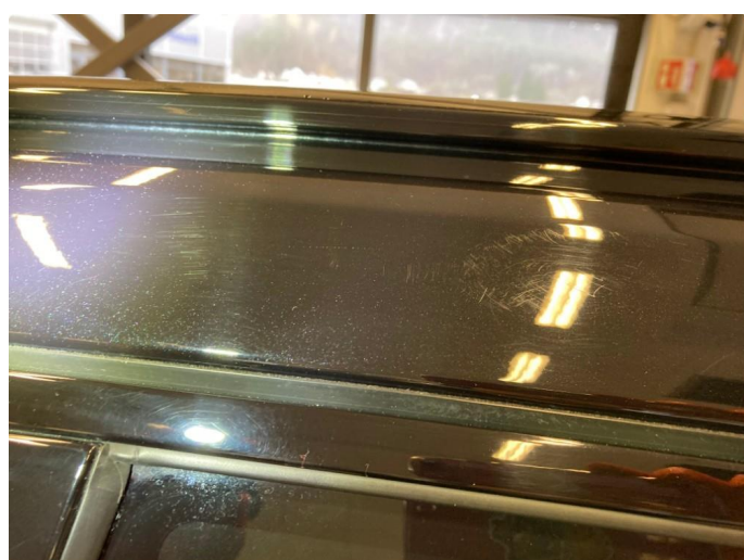
1.1 Generelt mye riper