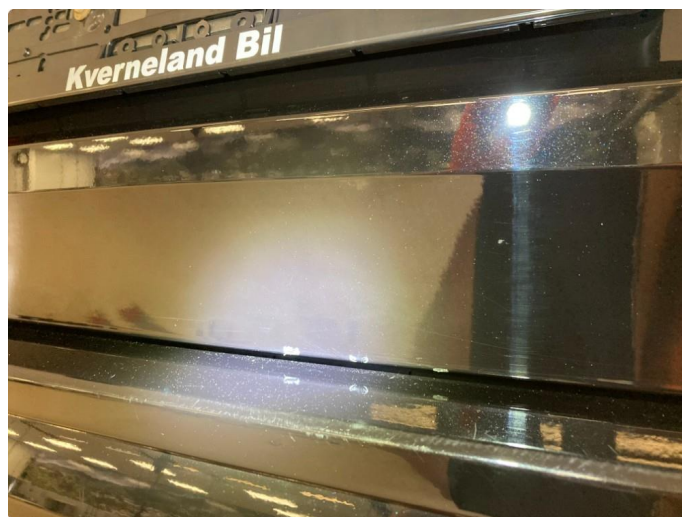
1.1 Generelt mye riper