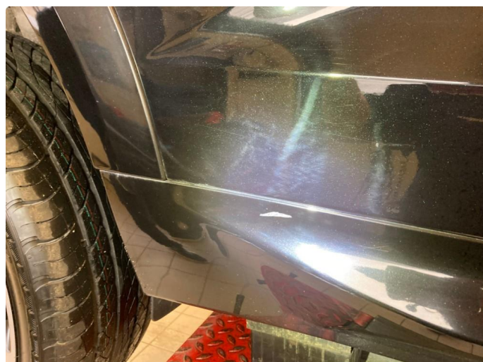
1.1 Generelt mye riper