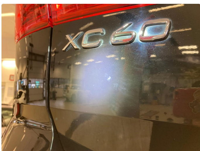
1.1 Generelt mye riper