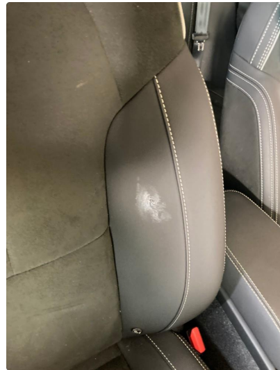
3.1 Øvrige feil