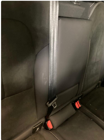
3.1 Øvrige feil